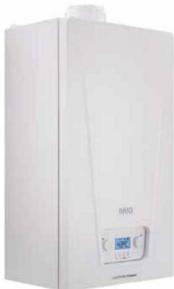
Základní modelová řada kondenzačního kotle Luna (BAXI). V nabídce je provedení kombi (24 kW nebo 28 kW) a model pro externí ohřev TUV v zásobníku o výkonu 24 kW, www.baxi.cz

při menších provozních nákladech a s mnohem menším ekologickým zatížením pro okolí, než tomu bylo v minulosti. Díky zplyňování je palivo velmi účinně využito, automaticky řízené systémy mohou dosáhnout účinnosti dokonce až 90 %. Kromě toho znamená pořízení automatického kotle také vysoký uživatelský komfort.