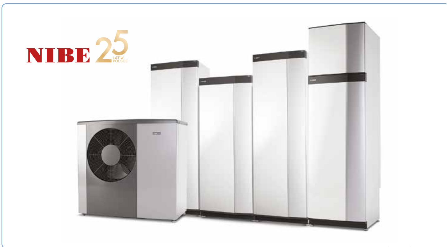
NIBE SERIA S

Misją NIBE jest zapewnienie życia w przyszłości w zgodzie z ideą zrównoważonego rozwoju w oparciu o odnawialne źródła energii. Niezwykle istotną cechą charakterystyczną dla wszystkich urządzeń z logo NIBE jest energooszczędność, ale wraz z nią użytkownicy otrzymują coś więcej – urządzenie będące swoistym manifestem polityki marki, która opiera się na edukowaniu społeczeństwa w zakresie odnawialnych źródeł energii.