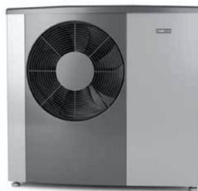
Tepelné čerpadlo NIBE S2125.