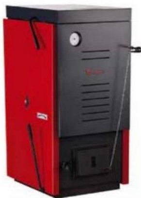
Univerzální ocelový kotel Dakon DOR 4F spaluje hnědé uhlí a splňuje emisní třídu 4. Vysoká účinnost spalování, jednoduchá regulace výkonu. Bosch Termotechnika