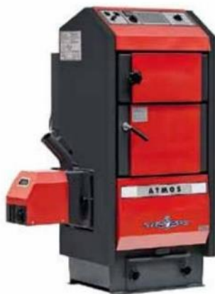
Automatický kotel na pelety Atmos D20P má účinnost přes 90%, je zařazen v 5. emisní třídě a splňuje podmínky pro získání kotlíkové dotace. Atmos