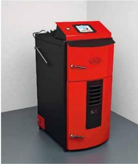
Kombinovaný kotel na biomasu Attack SLX Combi Pellet splňuje nejvyšší standardy pro tepelná zařízení využívající dřevo a umožňuje spalování více paliv. Attack

fortu. Vyspělé technologie vám navíc umožní ovládat i kotel na pevná paliva prostřednictvím webového rozhraní či chytrého telefonu.