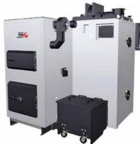
Rakouské kotle Fröling spalují ve špičkové kvalitě dřevo, pelety nebo štěpku. Výhradním dovozcem pro Česko a Slovensko je společnost S WHG. Fröling

30 000 Kč (za lokální zdroj na biomasu se samočinnou dodávkou paliva) až po 140 000 Kč (za tepelné čerpadlo pro teplovodní systém vytápění s přípravou teplé vody připojené k fotovoltaickému systému). Při velkorysém přístupu k rekonstrukci můžete do jedné žádosti spojit hned několik oblastí podpory – třeba připojit zateplení, výstavbu zelené střechy, využití dešťové vody, instalaci stínící techniky nebo fotovoltaického systému. Tím navíc můžete získat zajímavý finanční