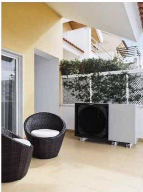
Monoblok v systému vzduch-voda reprezentuje třífázové tepelné čerpadlo Daikin Altherma 3 M se záložním ohřevačem 3 kW. Daikin