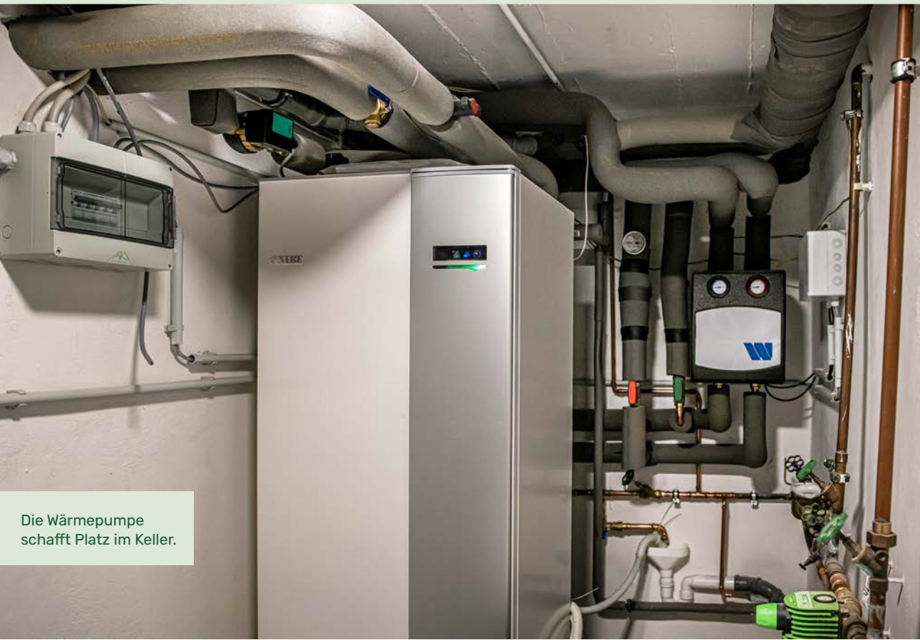
Die Wärmepumpe schafft Platz im Keller.