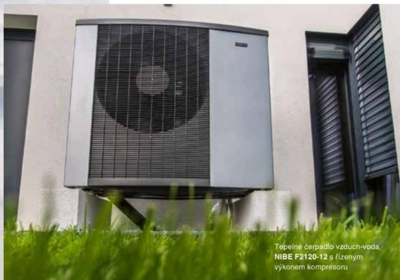
Tepelné čerpadlo vzduch-voda NIBE F2120-12 s řízeným výkonem kompresoru

Důvod výběru TČ (konkrétní druh): tiché a výkonné tepelné čerpadlo