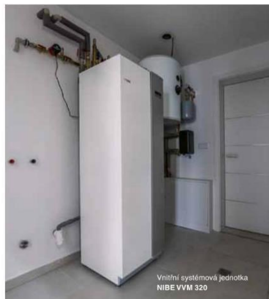
Vnitřní systémová jednotka NIBE VVM 320

Efektivní řídicí systém tepelného čerpadla NIBE F2120-12 automaticky reguluje vnitřní klima, zajišťuje maximální pohodlí a chrání životní prostředí.