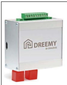
■ Chytré zařízení Dreemy

Jak efektivně zkombinovat fotovoltaickou elektrárnu s tepelným čerpadlem? Pomocí nadřazeného řídicího systému